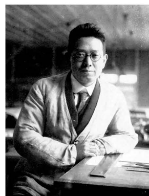
建築家 山田 守