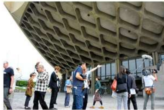
県立体育館を視察するドコモモ関係者ら＝高松市福岡町2丁目

建築の国際学術組織「DOCOMOMO（ドコモモ）」の幹部ら約30人が30日、世界的建築家・丹下健三が手がけた県庁舎東館や県立体育館を視察した。いずれも現在の耐震基準を満たしておらず対応が検討されている両施設について、保存の必要性を訴えた。