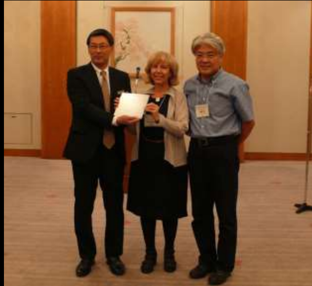
■ 倉敷国際ホテル 2014-0930