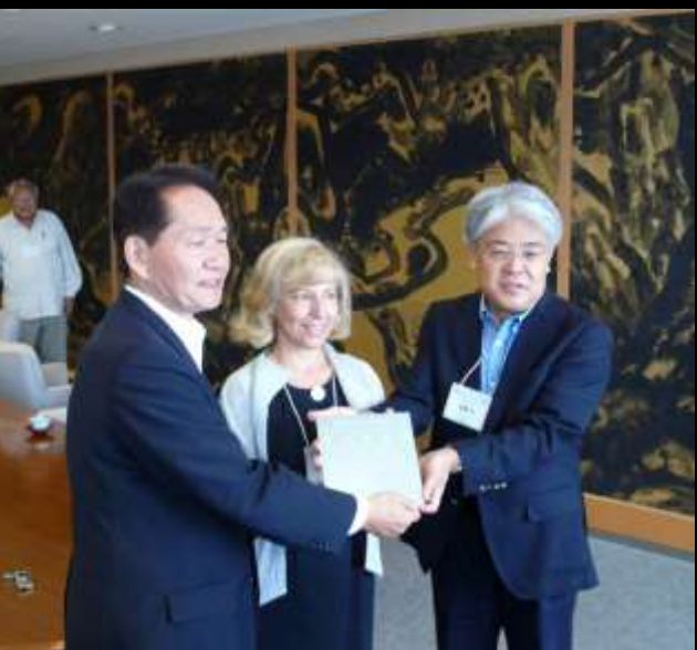
■ 瀬戸内海歴史民俗資料館 2014-0930