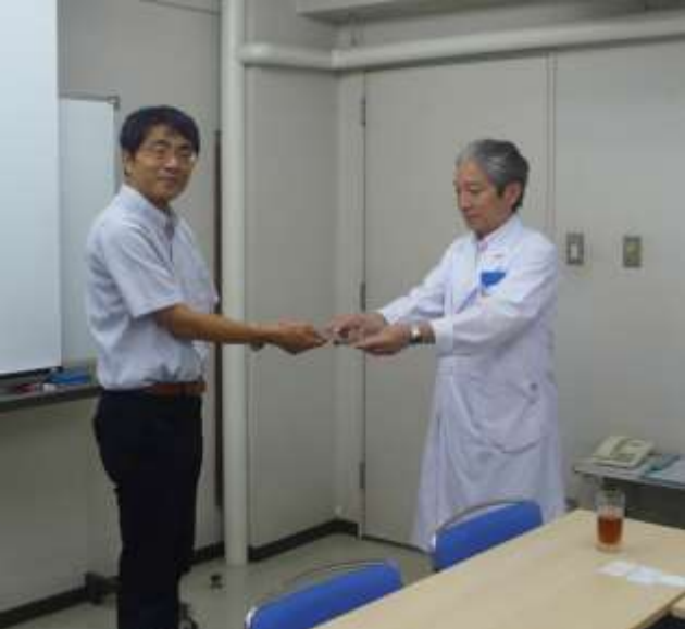
■ 聖ヨゼフ病院 2014-0725