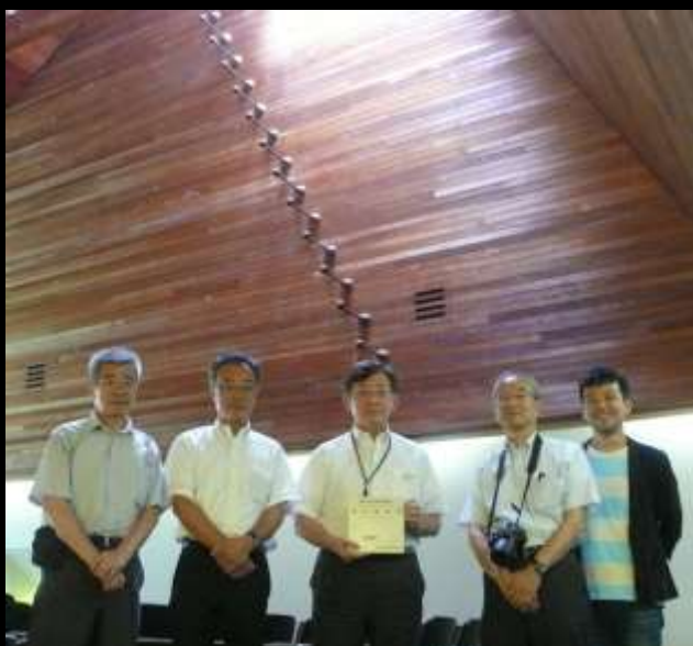
■ 所沢聖地霊園礼拝堂 2014-0729