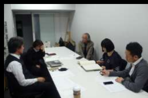
会合 総会、幹事会、例会、選定WG、編集会議